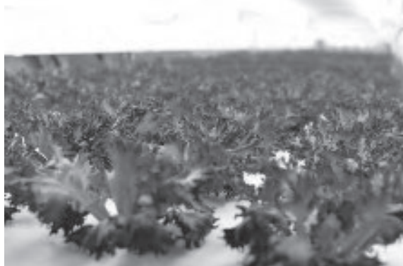
※三進金属工業グループ・M式水耕栽培研究所 ( http://www.gfm.co.jp/ )

水耕栽培のパイオニア“M式水耕栽培研究所”と 産業用ストレージ設備と研究実験設備で豊富な実績を持つ三進金属工業が融合。 農業にイノベーションをもたらす“植物工場”を、 計画から設計、製造、設置、栽培、運営まで、幅広くサポートします。 だから三進金属工業なら植物育成はラボからプラントまで一括対応が可能です。