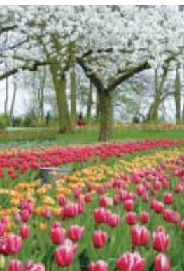
キューケンホフ公園・オランダ アムステルダム郊外