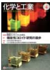
表紙：高発光性 Zn S-AgInS 2 ナノ粒子分散液（上）紫外光下（下）室内光下