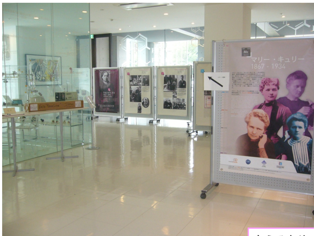
ケミストリーギャラリーに併設さ れた展示会場の様子