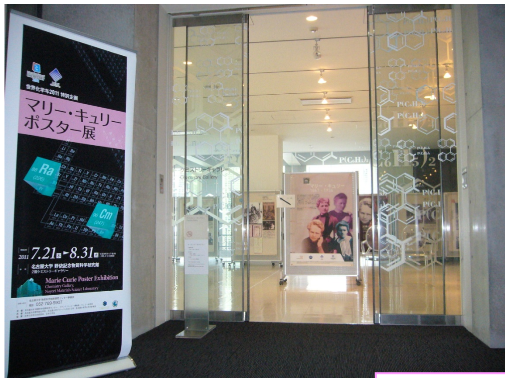
名古屋大学 野依記念物質科学研究館 展示会場入口